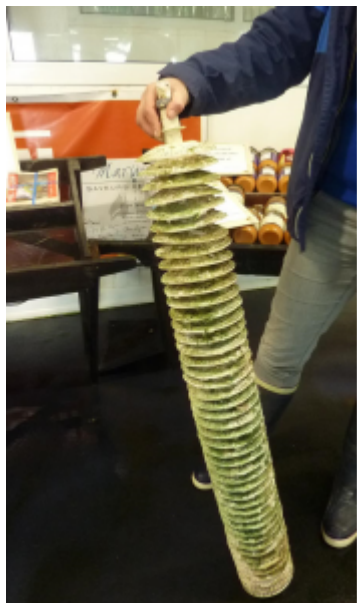
couppelles à naissain

«Nous n'utilisons pas de tuile chaulée pour capter le naissain car l'extraction des jeunes huîtres pour les mettre en poche est plus traumatisante qu'avec les couppelles», précise Caroline (La tuile est enduite de chaux et de sable et offerte au naissain pour qu'il vienne s'y fixer. Avant d'être transférés dans les poches à huîtres, les bébés doivent être détachés, ndlr). Même avec de telles mesures de protection, la mortalité est de 70% sur les huîtres creuses, plus encore sur les huîtres plates. Une recrudescence des pertes a d'ailleurs pu être observée ces dernières années.