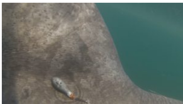
Balise Mini-PAT fixée à la base de l'aile du requin

La balise MiniPat enregistre différents paramètres à intervalle de temps régulier (pression, température de l'eau et luminosité). Prévue pour se décrocher au bout d'une année, elle remontera alors à la surface pour transmettre toutes les données enregistrées, toujours via les satellites ARGOS. Il sera alors possible de connaître le profil de ses plongées, mais aussi de faire une estimation du trajet réalisé par le requin.