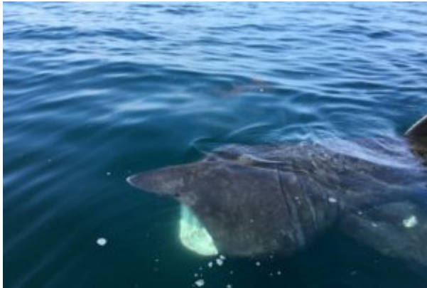
Requin pèlerin en train de se nourrir

Ce géant peut être observé à la surface de l'eau dans certains secteurs et à certaines périodes de l'année. Nageant paisiblement la gueule ouverte, il filtre l'eau (l'équivalent d'une piscine olympique par heure, soit environ 3 000 m 3 d'eau). Il est particulièrement friand de copépodes, crustacés microscopique, qu'il va collecter grâce à des peignes branchiaux situés au niveau de ses branchies.