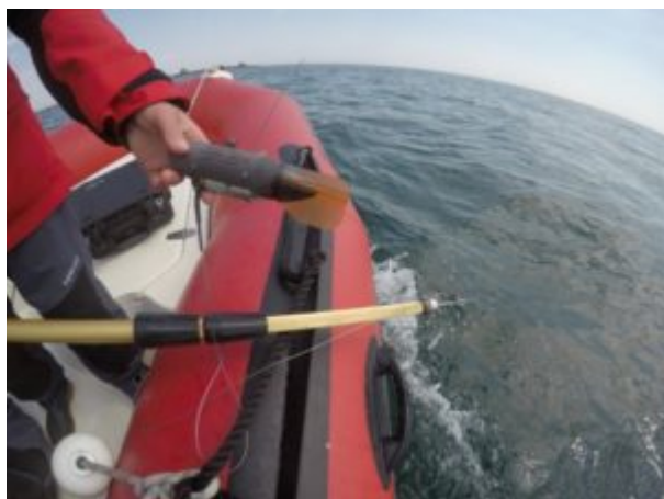
Balise SPOT qui sera fixée à la base de l'aile du requin et tractée

La balise MiniPat enregistre différents paramètres à intervalle de temps régulier (pression, température de l'eau et luminosité). Prévue pour se décrocher au bout d'une année, elle remontera alors à la surface pour transmettre toutes les données enregistrées, toujours via les satellites ARGOS. Il sera alors possible de connaître le profil de ses plongées, mais aussi de faire une estimation du trajet réalisé par le requin.