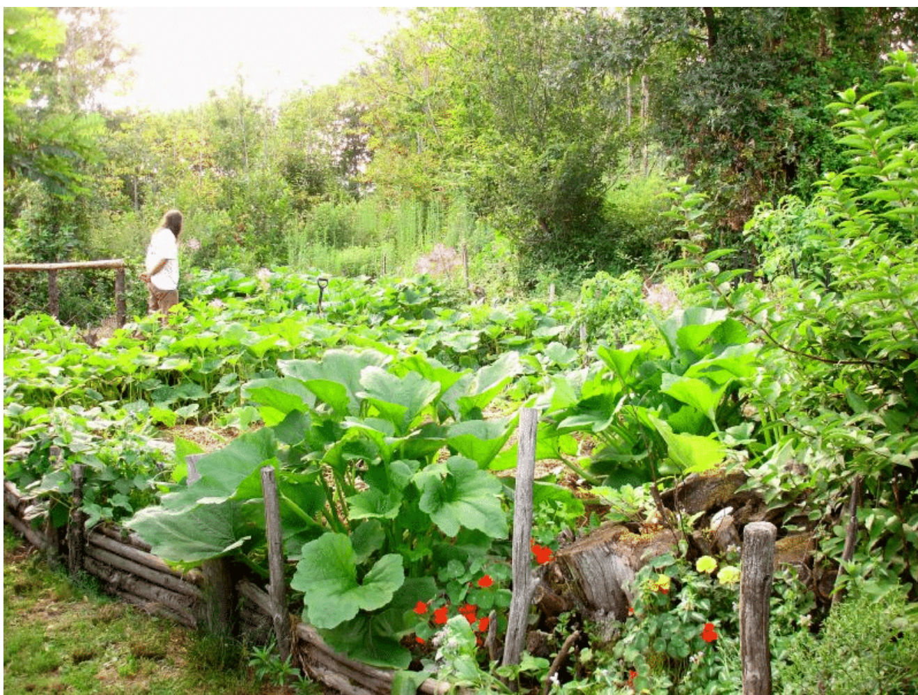
Jardin en permaculture

Par exemple, posséder le label « agriculture biologique » est souvent trop coûteux, alors qu'il s'agit de la meilleure assurance pour l'instant de produits non toxiques (outre le fait de connaître les producteurs locaux). Cela devrait être l'inverse : les alternatives et l'agriculture biologique devraient être subventionnées, sans logo à charges, et les produits issus d'une agriculture intensive ou employant des pesticides avec un logo payant attestant de leur dangerosité sur l'environnement et la santé. Il faudrait aussi interdire tout emploi de pesticides, d'engrais de synthèse, et autres produits issus de firmes multinationales telles que Monsanto et Bayer, pour ne citer qu'elles {20} .