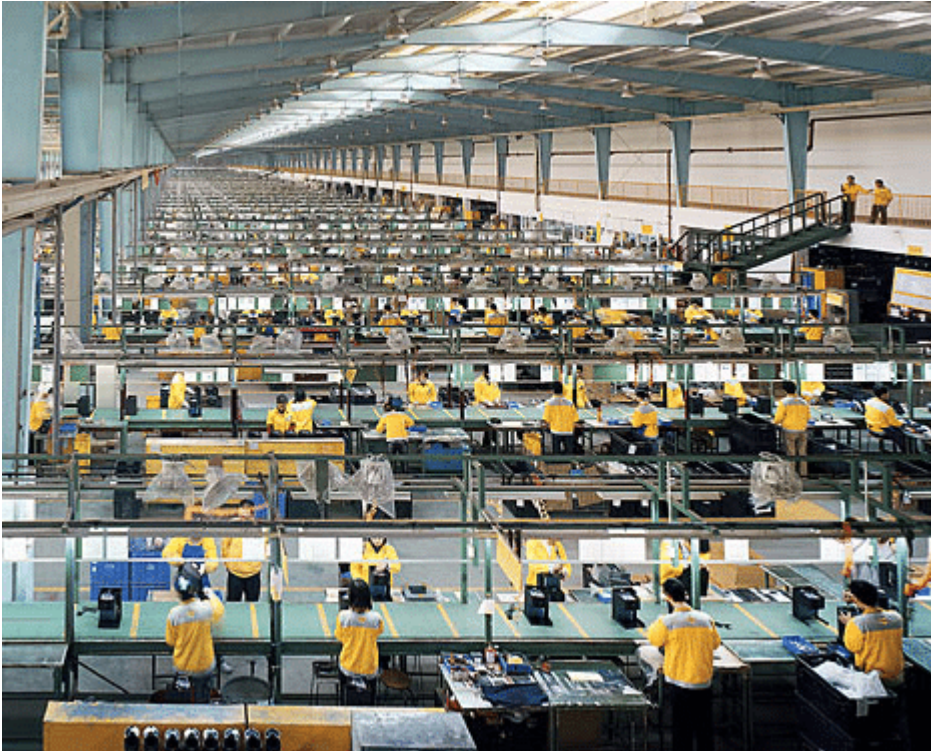
Usine d'électronique en Chine

Etant très lié aux énergies, les émissions GES des industries pourrait diminuer en partie si nous dépolluons nos énergies. Cette dépollution semble cependant difficile car la plupart des industries occidentales se sont délocalisées dans les pays en développement, pays où les moyens manquent pour avoir recours aux énergies renouvelables. Aussi, cette délocalisation pose plusieurs problèmes d'ordre éthique et écologique. En outre, une grande partie de la pollution des pays en développement correspond en réalité à celle des pays riches ... Les populations pauvres en subissant toutes les conséquences négatives (surexploitation des travailleurs, pollutions, destruction de leur environnement, maladies, appauvrissement, changements climatiques, etc).