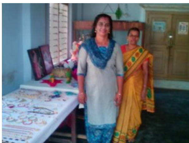
La formatrice principale (à gauche), ancienne stagiaire, à côté d'une de ses stagiaires, future formatrice.