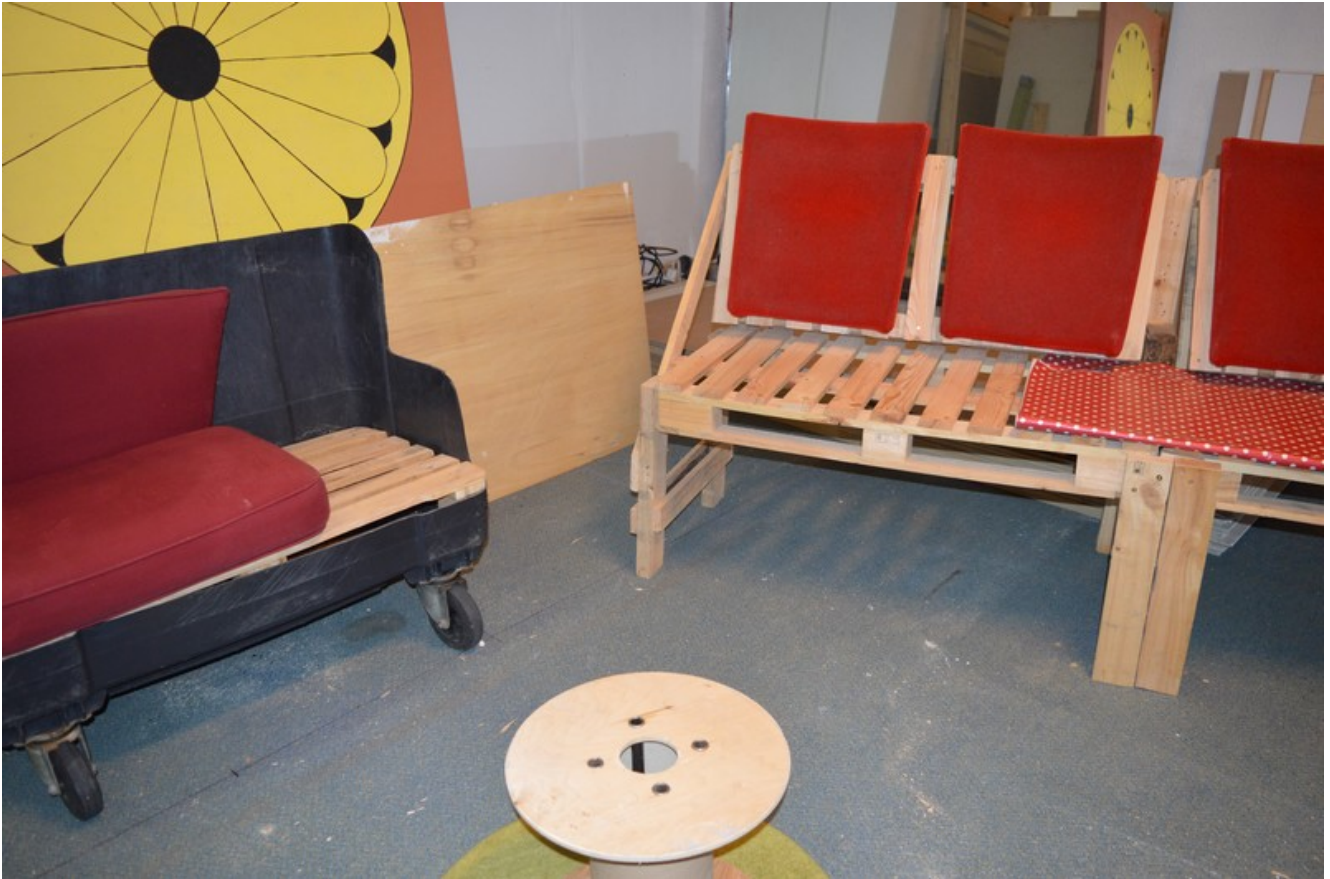
Les meubles sont à base de récup' ou comme ici, de palettes