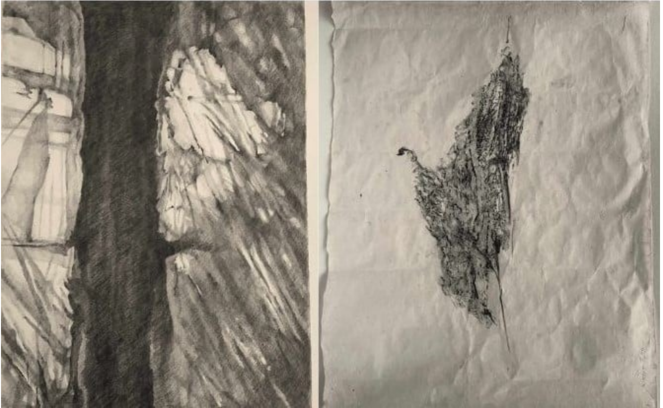
Janvier 2024_ombres Graphite sur papier Japon – Mai 2024_écorce Graphite sur papier japon

« Le passé du jardin : il était une fois une chèvre, gentille bête qui, grâce à son appétit féroce, dévora les ronces d'un verger abandonné. La chèvre permit de renouer avec la plénitude de